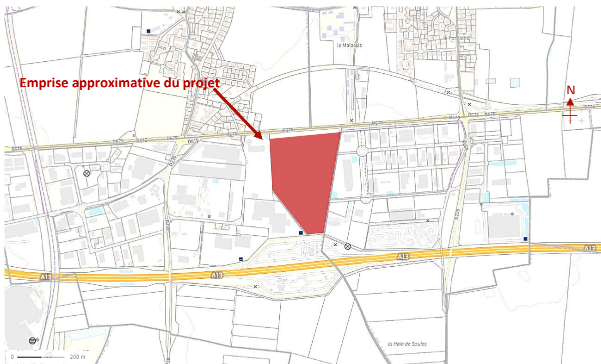
Figure 2 : Localisation rapprochée du projet sur fond IGN